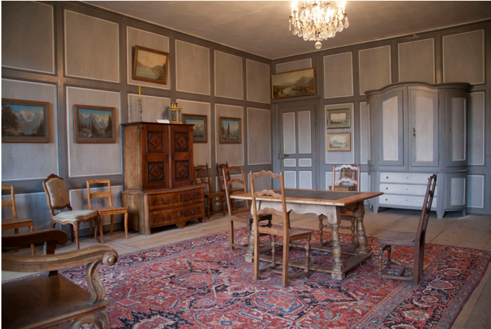
Le salon avant les travaux de restauration de 2014.

Ce salon restauré en 2014 contient des objets et tableaux rappelant les baillis bernois. Au cours des siècles, diverses couches de peinture se sont superposées sur les boiseries. Lors des travaux, nous essayons de retrouver la couche de peinture la plus ancienne. C'est ainsi que ce salon a passé du gris à l'ocre.