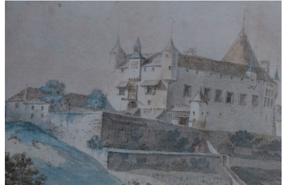
Zwei Aquarelle von Mériquot

Diese dem Vogt Tschiffeli gewidmeten Aquarelle stammen aus dem Jahre 1777. Man erkennt darauf einen kleinen Baum, der zur heutigen grossen Platane herangewachsen ist.