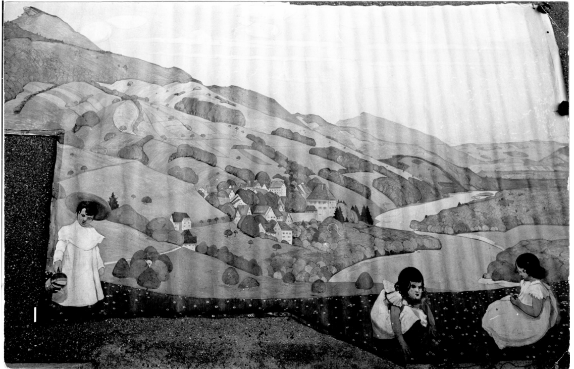
Ernest Bolens, tableau mural de l'hôtel Aarauerhof à Aarau peint vers 1920, dimensions originales après le démontage en 1969, actuellement séparé en 2 tableaux exposés dans le hall de la salle des Oron.

En 1969 l'Hôtel Aarauerhof a été démoli pour faire place à une construction moderne. Lors de journées de vente publique, tout le contenu de l'ancien hôtel a été liquidé. Mon père, Oskar Frischknecht, qui s'y était rendu, a été frappé par le