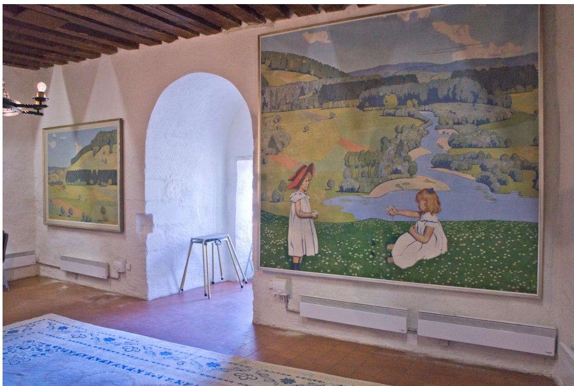
Max Burgmeier « Paysage fluvial » (vers 1920), 2 tableaux issus d'un tableau mural provenant de l'hôtel Aarauerhof à Aarau, exposés à la « Chapelle ».

rectangulaires: un tableau de grande dimension et un jumeau plus petit. Ces 4 tableaux ont agrémenté notre villa familiale pendant près de 30 ans.