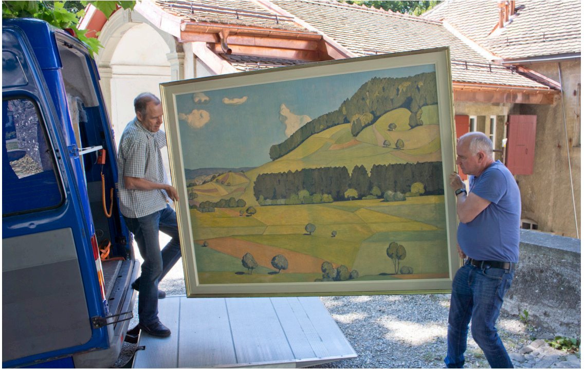
Max Burgmeier « Flanc de vallée » (vers 1920), partie droite d'un tableau mural provenant de l'hôtel Aarauerhof à Aarau, exposé à la « Chapelle ».

forêts. A l'avant-plan deux fillettes en habits de l'époque cueillent des fleurs sur un pré fleuri. La localisation de ce paysage reste inconnue.