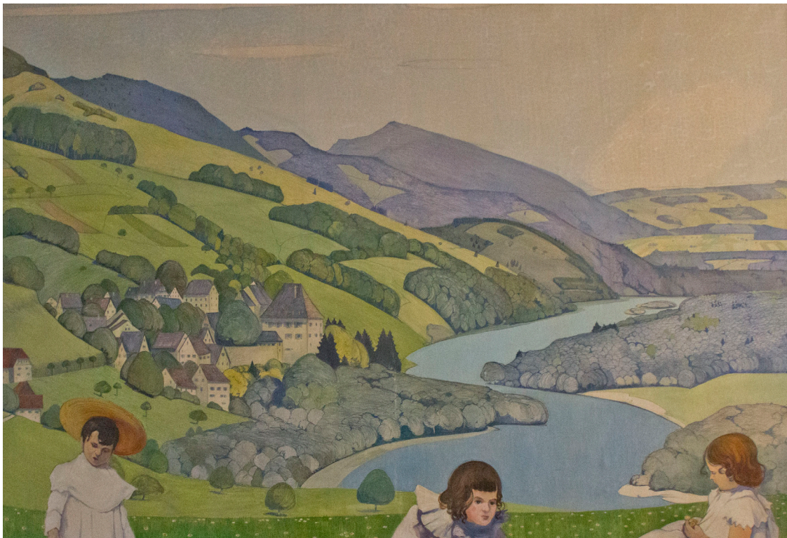
Ernest Bolens « Bourg et le Château de Biberstein avec Jura et vallée de l'Aar » (vers 1920), partie droite d'un tableau mural provenant de l'hôtel Aarauerhof à Aarau, exposé dans le hall de la salle des Oron.

désintéressé pour les deux tableaux muraux signés par Bolens et Burgmeier dont il connaissait la notoriété. Il a vu que les deux tableaux étaient peints sur des toiles tendues sur les murs et susceptibles d'en être détachés. Le préposé à la vente