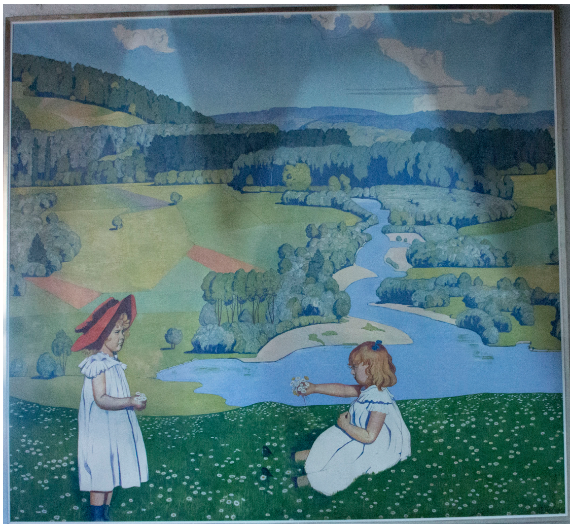
Max Burgmeier « Paysage fluvial » (vers 1920), partie gauche d'un tableau mural provenant de l'hôtel Aarauerhof à Aarau, exposés à la « Chapelle ».

Se posait alors la question du devenir des tableaux sauvés. Vu leur énorme taille il était difficile d'envisager une utilisation privée. De plus, les deux tableaux n'étaient pas rectangulaires, leurs dimensions ayant été adaptées aux données architecturales de l'hôtel (marches d'escalier, porte). Mon père pensait qu'on pouvait valoriser ce patrimoine argovien dans une institution publique et s'est adressé au Musée des Beaux-Arts d'Aarau pour qu'on l'aide à trouver une institution appropriée. Il était très déçu du désintérêt du musée pour ces tableaux, fait qu'il mentionnera encore souvent par la suite.