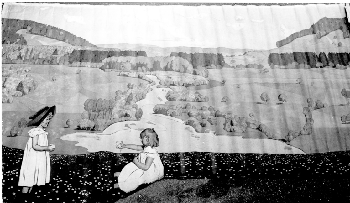
Max Burgmeier, tableau mural de l'hôtel Aarauerhof à Aarau peint vers 1920, dimensions originales après le démontage en 1969, actuellement séparé en 2 tableaux exposés à la « Chapelle ».

désintéressé pour les deux tableaux muraux signés par Bolens et Burgmeier dont il connaissait la notoriété. Il a vu que les deux tableaux étaient peints sur des toiles tendues sur les murs et susceptibles d'en être détachés. Le préposé à la vente