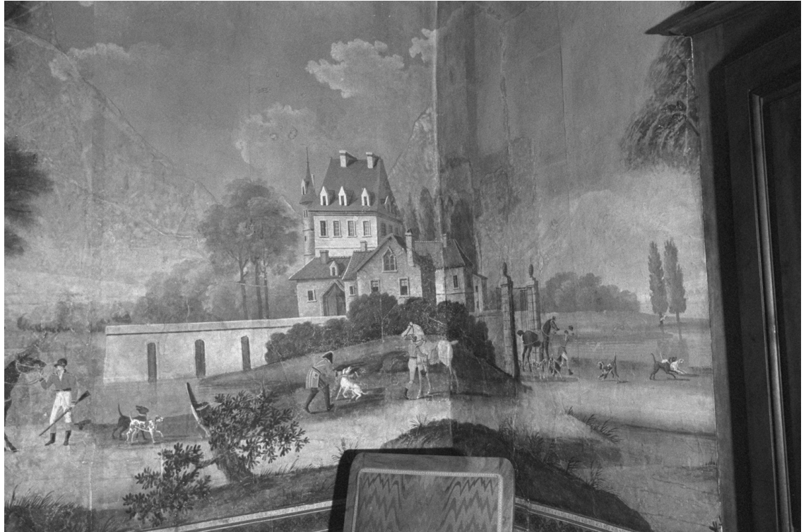
Fragment du salon de chasse