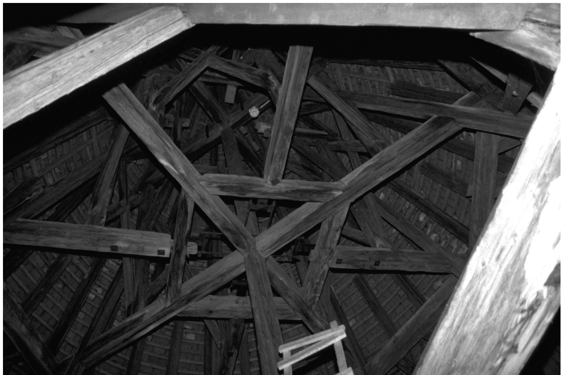
La poutraison du donjon