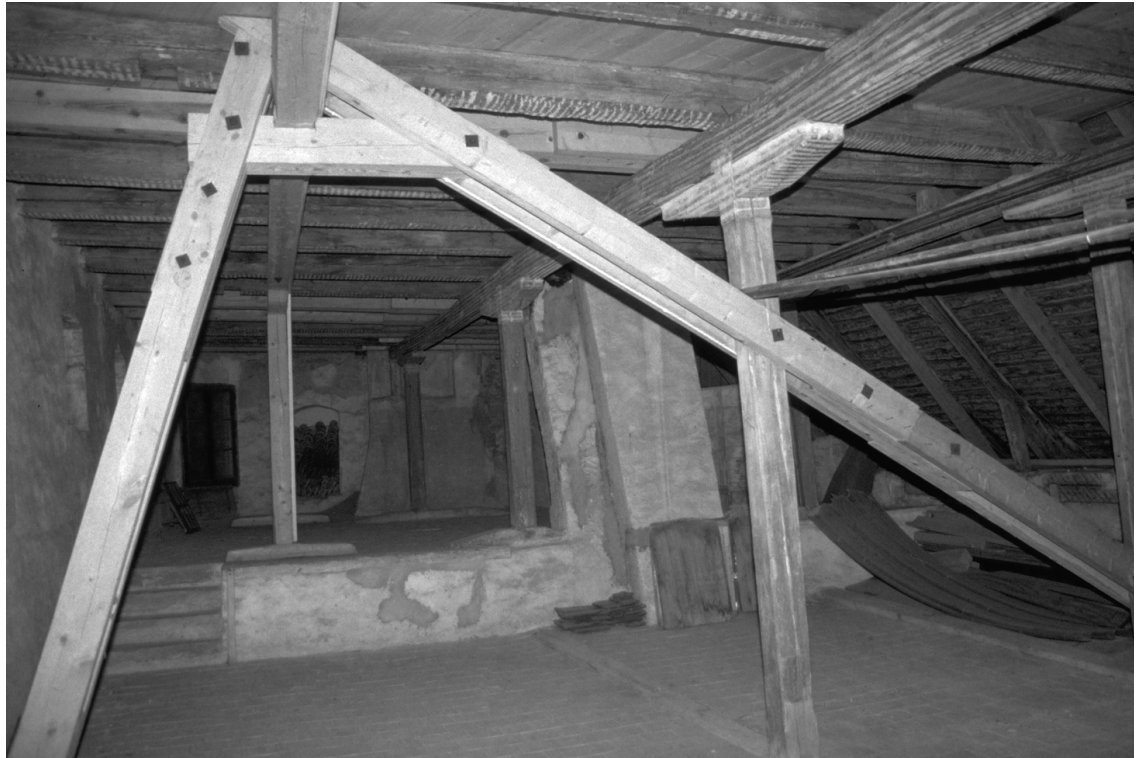
Une petite partie des combles