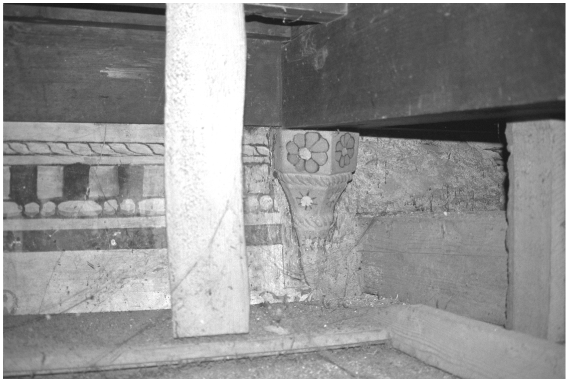
Fragment de l'ancien décor du salon de musique, visible depuis les combles