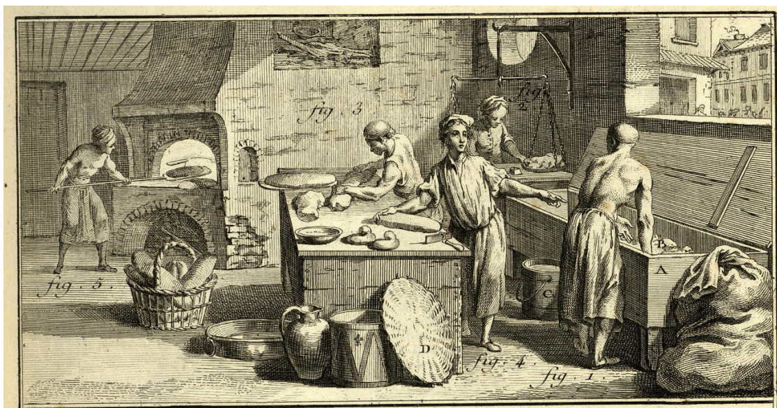
Gravure de l'Encyclopédie de Diderot et d'Alembert

Le boulanger aura besoin de quelques bénévoles pour l'aider: