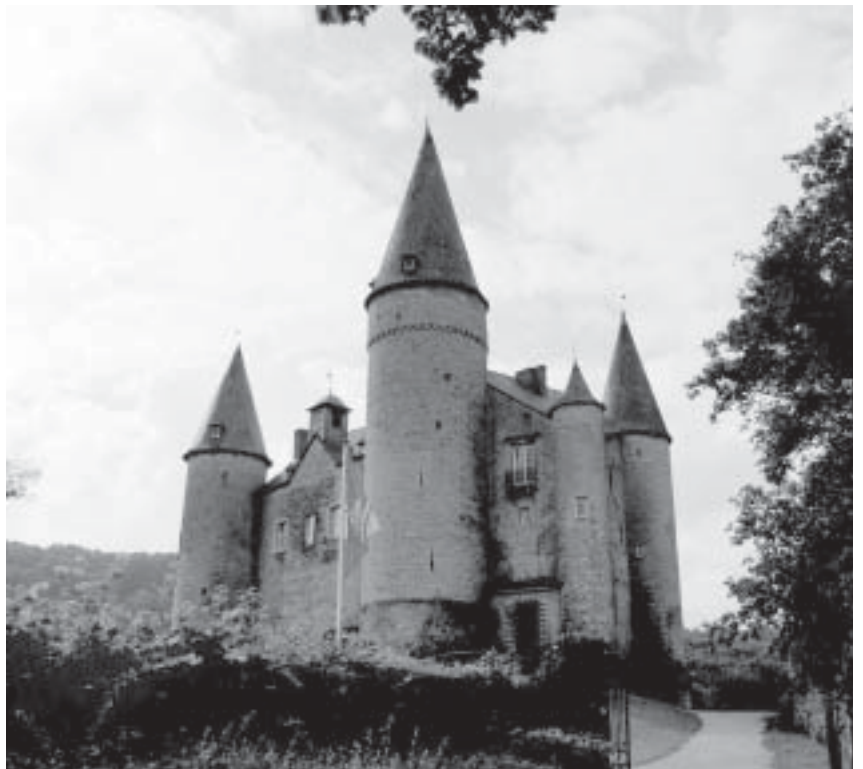
Château de Vêves