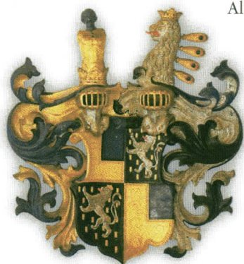
Das Wappen der Zollikofer von Altenklingen

Schon 1471 wird den Zollikofern von Kaiser Friedrich III. ein Wappenbrief