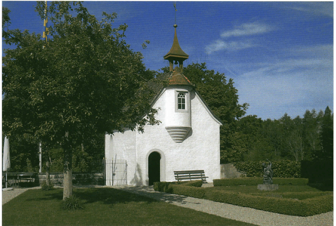
Die Schloßkapelle in Altenklingen

wird und einem ausklingenden Zeitgeschmack entspricht.