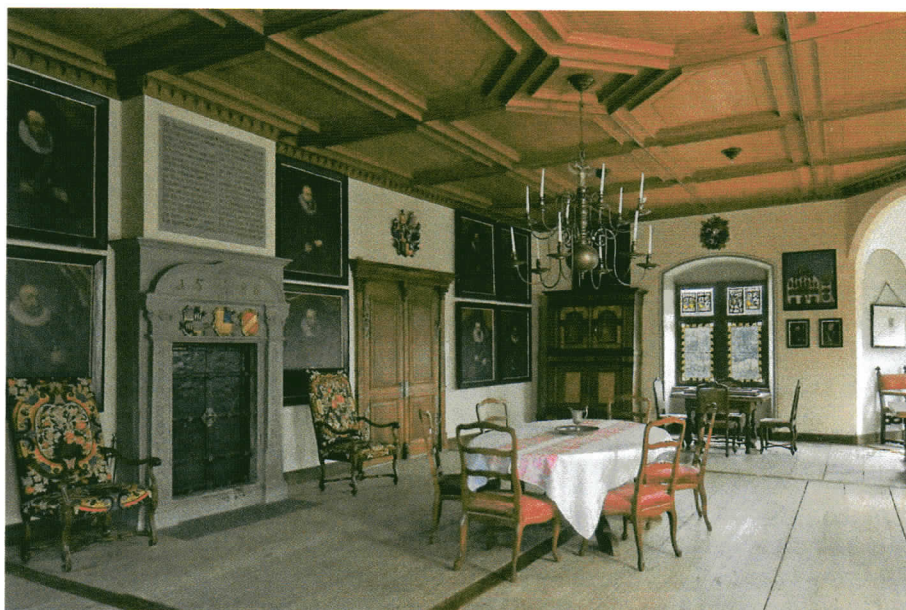
Ahnensaal im Großen Schloß